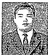
นักศึกษาชาย